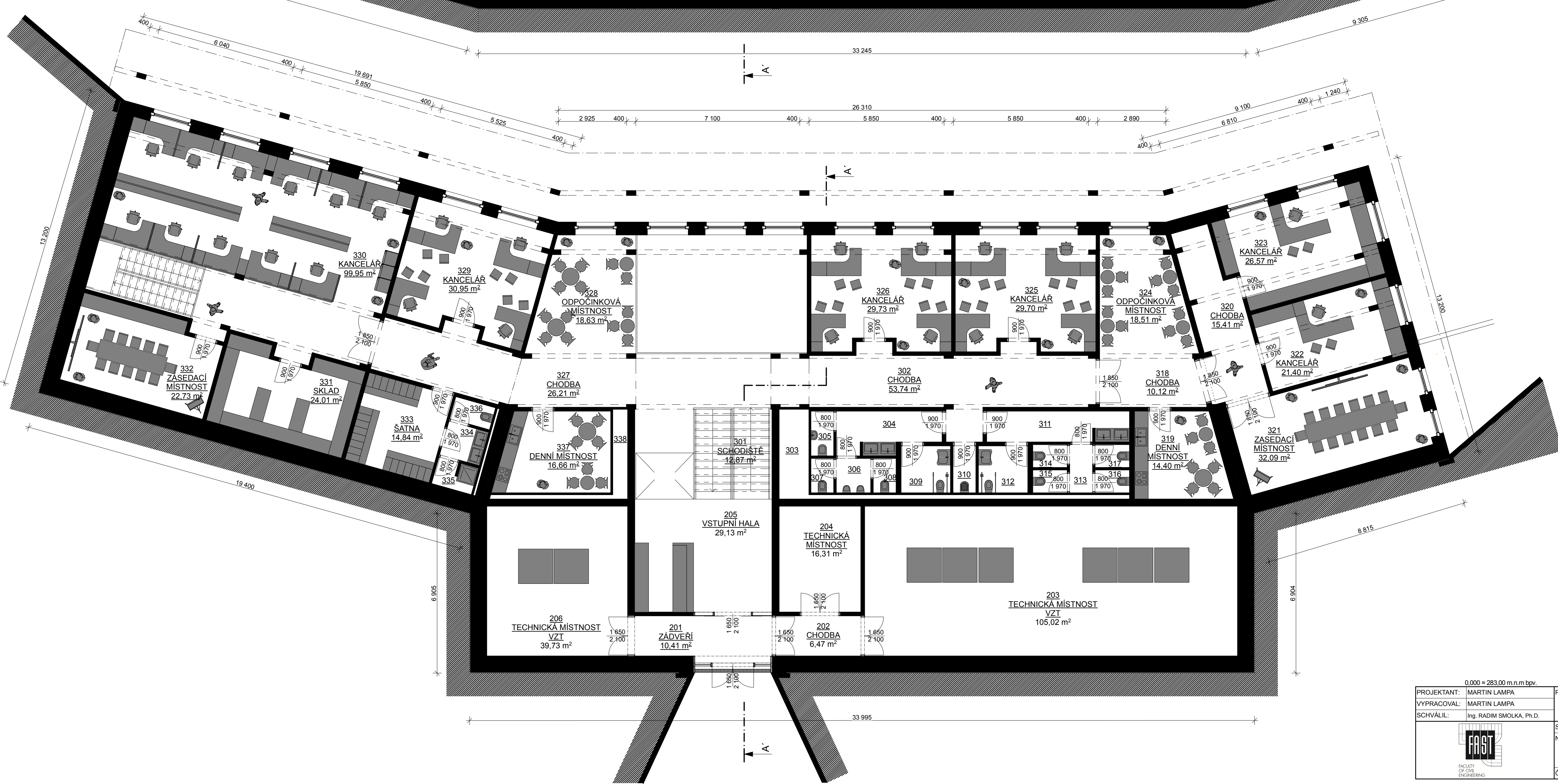
PŮDORYS 2NP, M 1:100